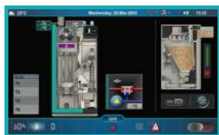
Multifunkční ovládání kotle pomocí 7" dotykového displeje.